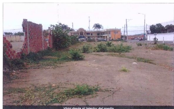
Vista desde el interior del predio