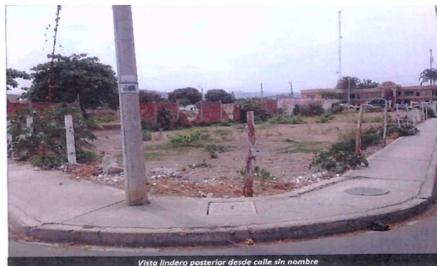
Vista linderos posterior desde calle sin nombre

LATERAL DERECHO: setenta metros cuarenta centímetros, con la propiedad de Hender.