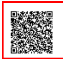
Figura 2.2.1: Código QR

Código de Validación: Serie de números y letras que garantizan la validez del documento; se ingresa el código a verificar y el número de identificación en el link: https://goo.gl/yOSZns , o mediante la opción Consultas Públicas de Servicios en línea , accediendo a Validación de Documentos / Validación de Certificados / Validación Historial de Autorizaciones , a continuación presentará la información registrada en el SRI.