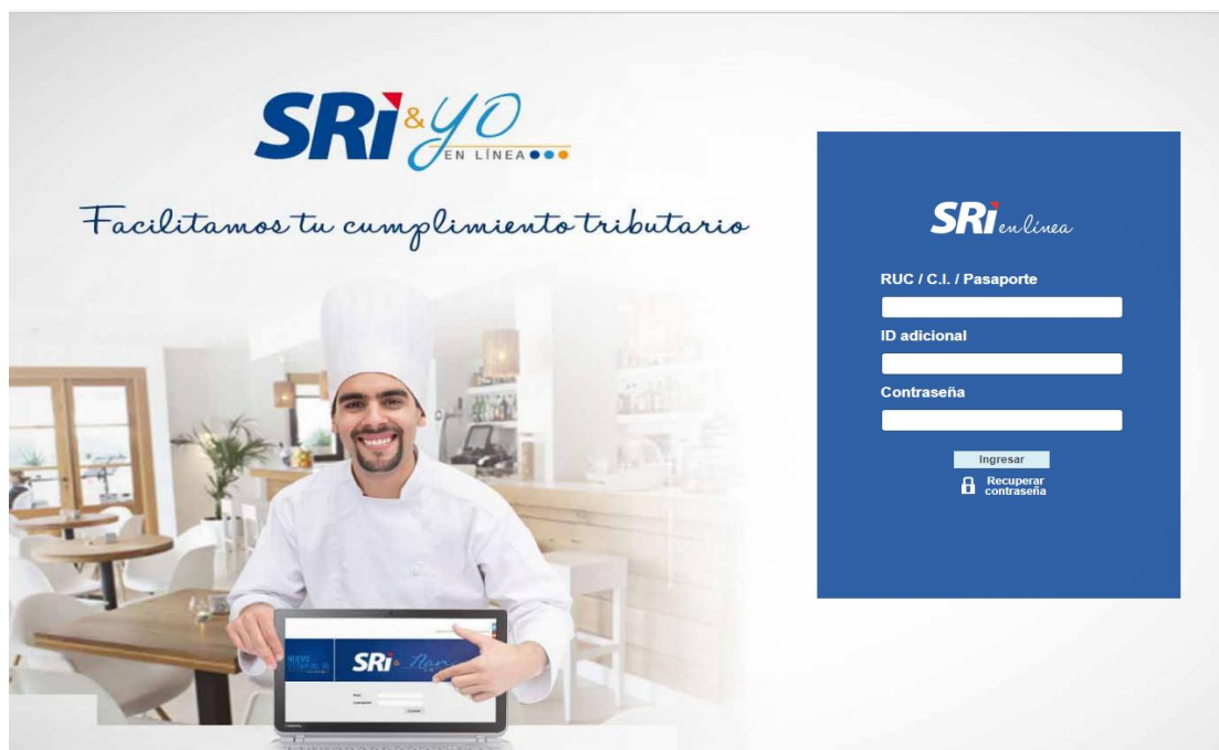
Figura 2.1.1: Página principal de acceso a servicios en línea del Servicio de Rentas Internas

Debe contar con la clave de uso de medios electrónicos que permite el acceso a los aplicativos a través de internet. Se ingresará el número de identificación correspondiente al RUC, CI adicional (si fuera el caso), y la contraseña.