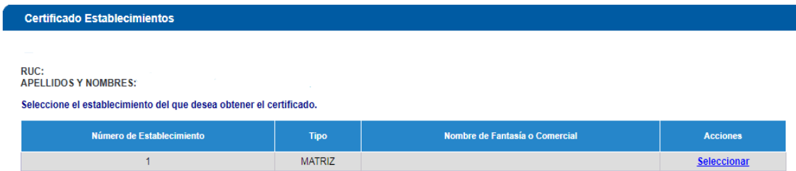
Figura 2.1.3: Certificado de Establecimientos

Al dar clic en la opción Certificado de Establecimientos (Abiertos/Cerrados) aparecerá la siguiente pantalla, donde deberá seleccionar el establecimiento del que desea obtener el certificado.