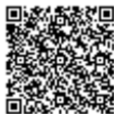
Figura 2.2.2: Código de Validación