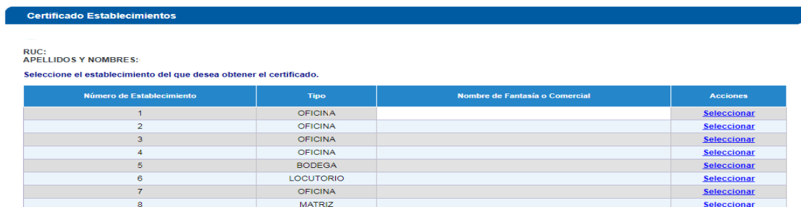
Figura 2.1.4: Certificado de Establecimientos

Nota: Si usted cuenta con más de 10 establecimientos registrados en su RUC, deberá verificar el número de establecimiento y presionar el botón “Seleccionar”.