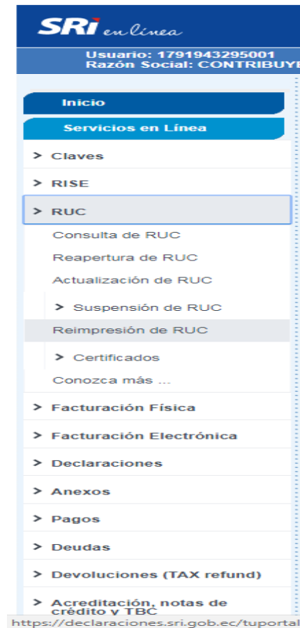
Figura 2.1.3: Menú de acceso

Una vez validada la identificación con su clave electrónica, deberá ingresar a la opción General / Certificados Tributarios / Reimpresión de RUC .