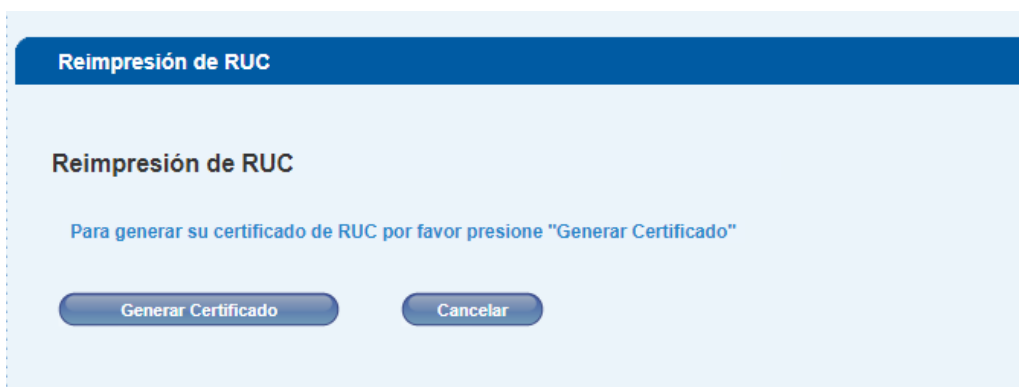
Figura 2.1.4: Flujo Reimpresión de RUC

Al seleccionar Reimpresión de RUC , aparecerán las siguientes opciones.