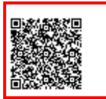
Figura 2.2.1: Código QR

Código de Validación: Serie de números y letras que garantizan la validez del documento; se ingresa el código a verificar y el número de identificación en el link: https://goo.gl/yOSZns , o mediante la opción Consultas Públicas de Servicios en línea , accediendo a Validación de Documentos / Validación de Certificados / Validación Historial de Autorizaciones, a continuación presentará la información registrada en el SRI.