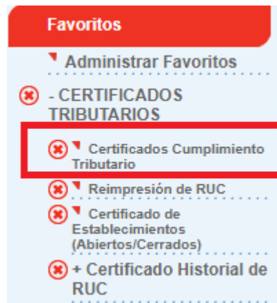
Figura 4. Sub menú de consulta

En el menú Certificados Tributarios, busque la opción Certificados Cumplimiento Tributario :