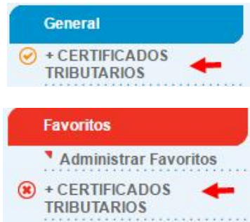
Figura 3. Menú de acceso

En el menú Certificados Tributarios, busque la opción Certificados Cumplimiento Tributario :