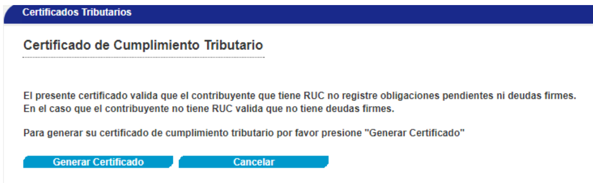
Figura 5. Flujo Certificados Cumplimiento Tributario

Se despliega la siguiente pantalla al escoger la opción Certificados Cumplimiento Tributario :