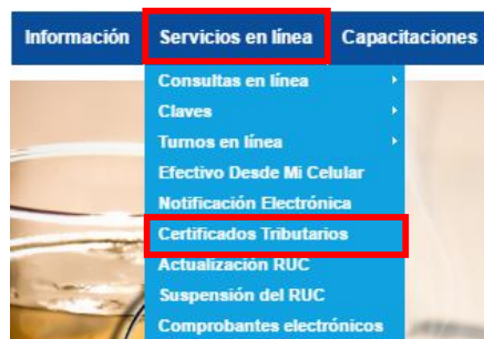
Figura 1. Página principal de acceso a servicios en línea del SRI

Para obtener un Certificado Cumplimiento Tributario , ingrese a la página web del Servicio de Rentas Internas www.sri.gob.ec , en la pestaña Servicios en línea y escoja la opción Certificados Tributarios: