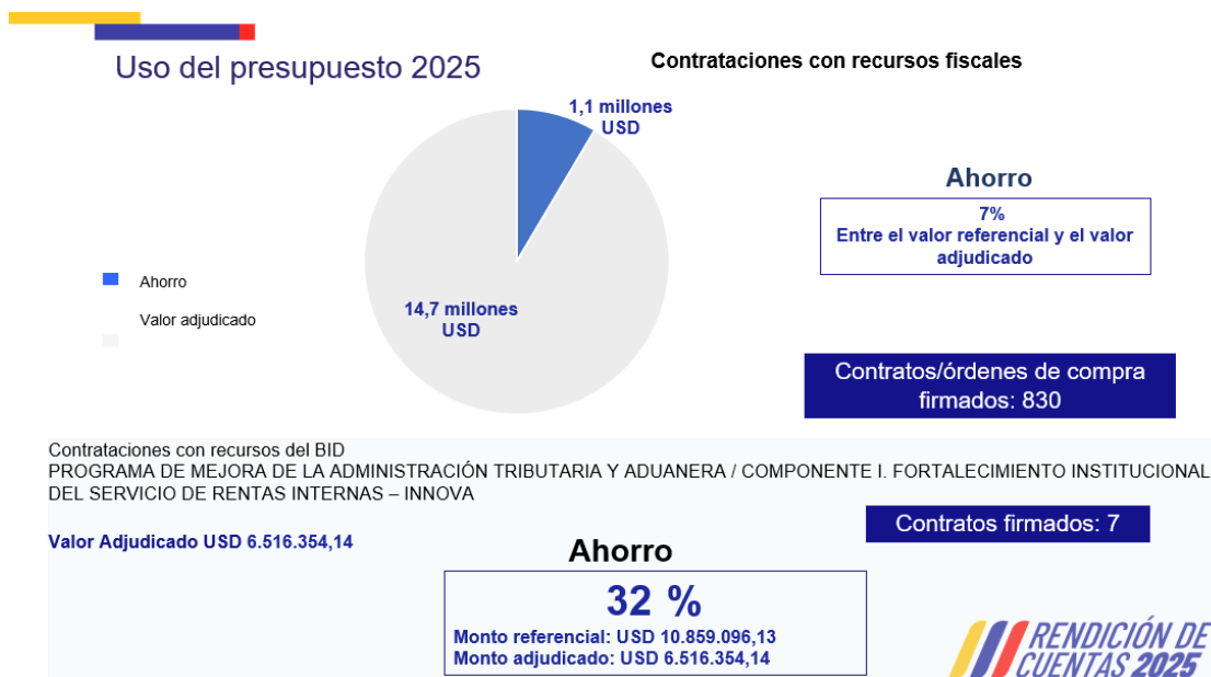
Gráfico No. 2 Uso del presupuesto

Fecha de corte: 31 de diciembre de 2025.