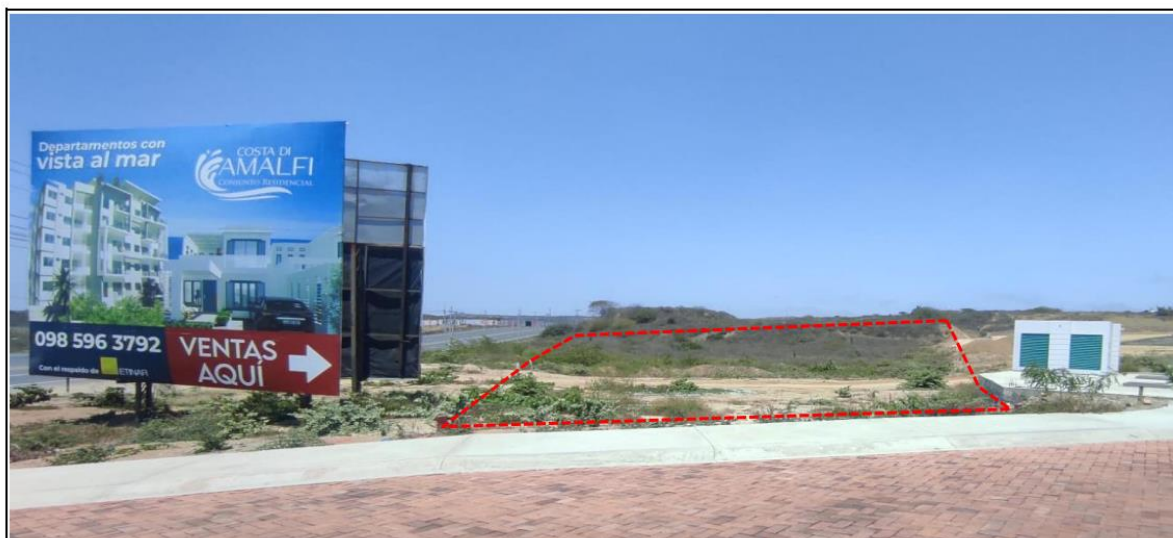
UBICACIÓN E IMPLANTACIÓN

La Dirección Zonal 8 del Servicio de Rentas Internas, a través del Departamento de Cobro, PONE EN CONOCIMIENTO DEL PÚBLICO EN GENERAL , para los fines legales pertinentes y amparado en los Arts. 184 y 185 del Código Tributario que se llevará a efecto el día 28 de octubre de 2024 , de 15:00 a 18:00 horas, el REMATE PÚBLICO de los derechos y acciones equivalentes al 33,33 del bien inmueble embargado y debidamente avaluado cuyo detalle es el siguiente: