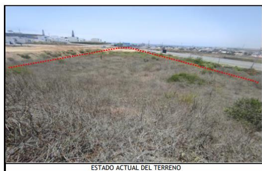
ESTADO ACTUAL DEL TERRENO