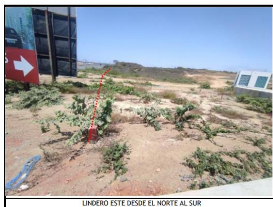
LINDERO ESTE DESDE EL NORTE AL SUR