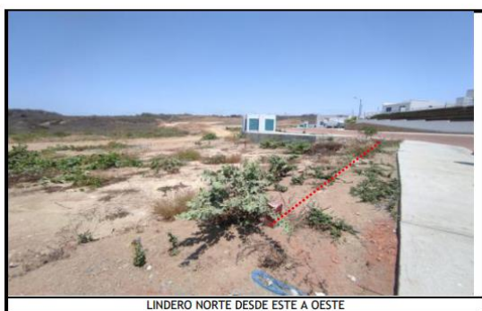
LINDERO NORTE DESDE ESTE A OESTE