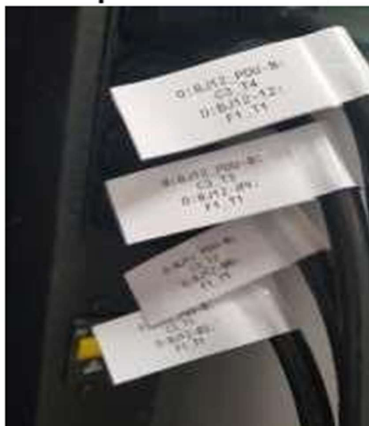
Figura 8. Etiquetación

Tamaño de letra: 12 Tipo de letra: Consolas Tipo de etiquetación: Bandera