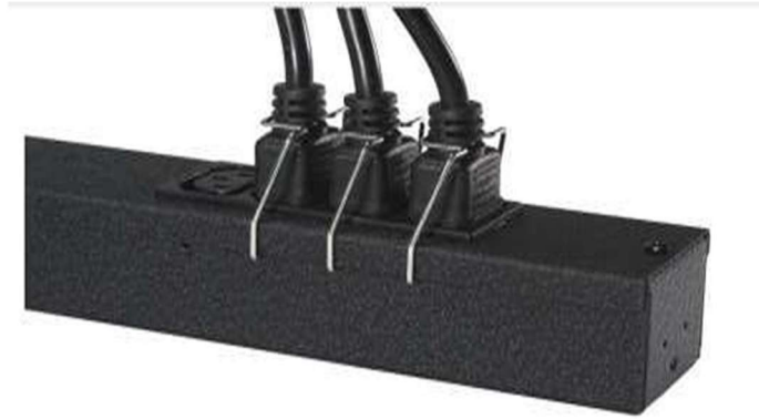
Figura 1. Seguros físicos de fijación de cableado eléctrico a las RPDU