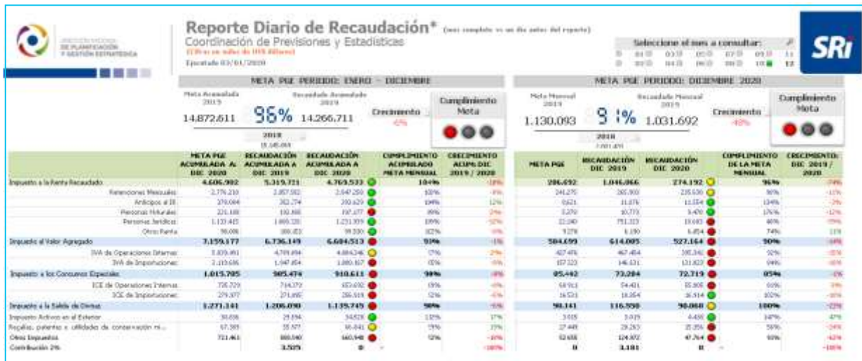
Cuadro No. 1 Reporte diario de recaudación

Fuente: Base de Datos SRI Elaborado por: Departamento de Planificación Institucional