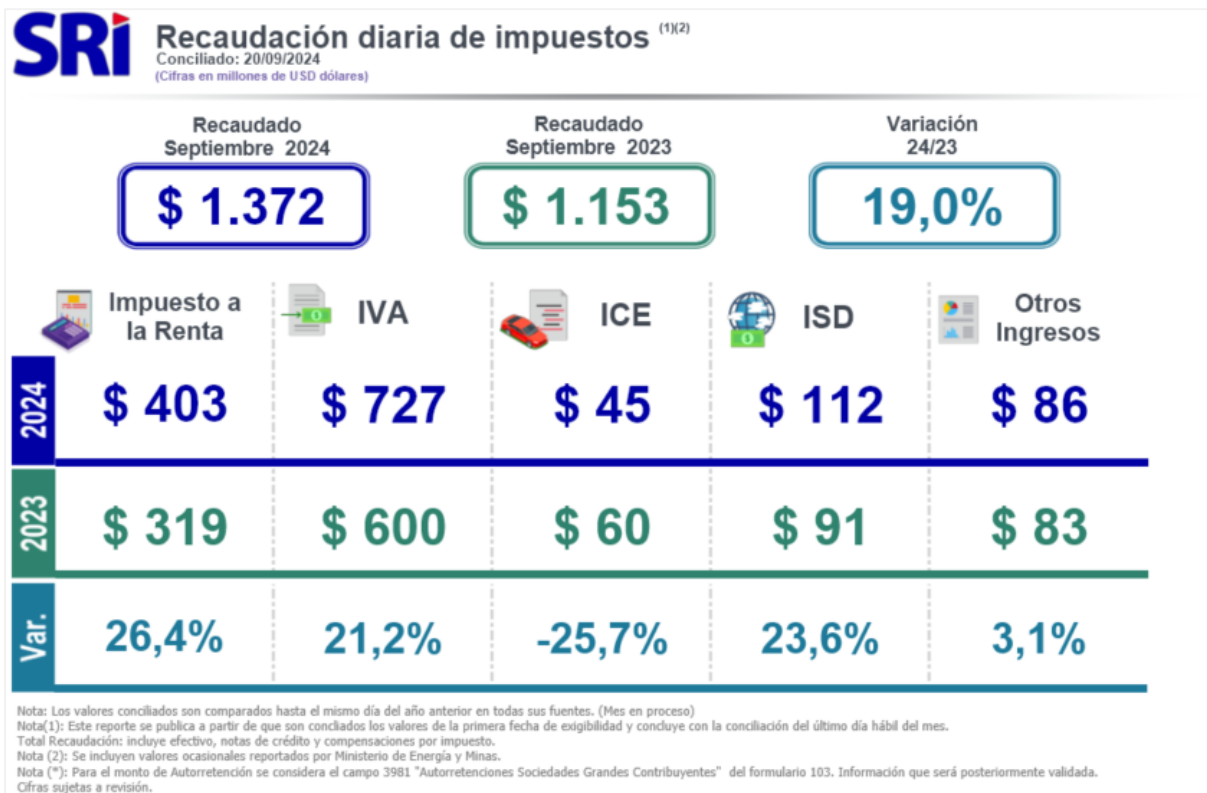
Imagen No. 1: Recaudación Diaria Imagen referencial

El reporte de recaudación diaria se publica en la sección Estadísticas de Recaudación de Impuestos de la página web del SRI.