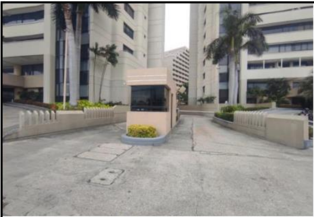
INGRESO VEHICULAR A SUBSUELOS