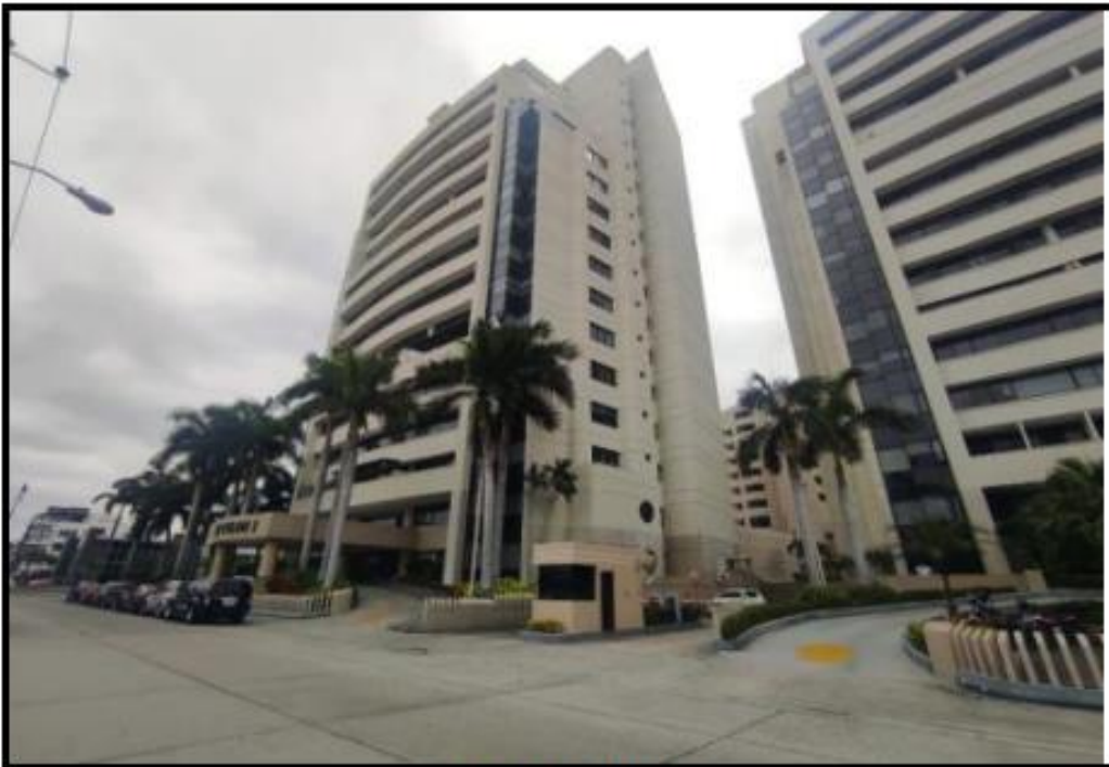
VISTA DE LA TORRE 1