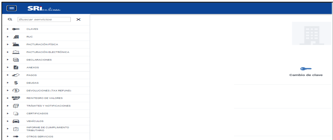
Figura 2: Menú SRI en línea

Al hacer clic sobre Facturación Física se muestran las opciones siguientes, seleccione Imprentas autorizadas :