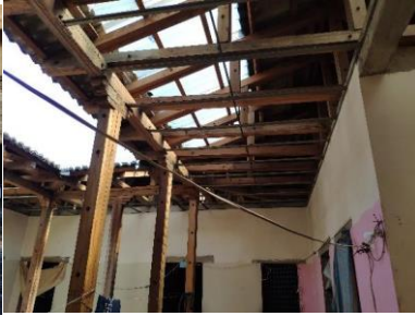
ESTRUCTURA DE CUBIERTA