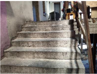
ESCALERA A SEGUNDA PLANTA