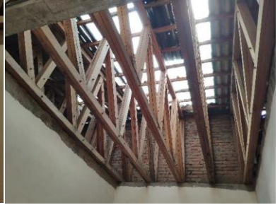
ESTRUCTURA DE CUBIERTA