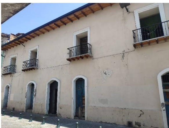
FACHADA CALLE CUENCA

La zona y el inmueble cuentan con un acceso principal desde la avenida 24 de Mayo, siendo esta vía la de mayor circulación; además, se encuentra a una cuadra de la estación del metro.